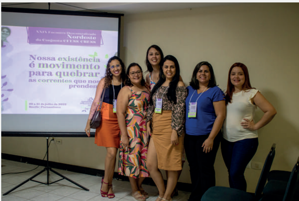
Foto do evento.

O evento foi preparatório para o Encontro Nacional, que vai acontecer em Maceió (AL) de 08 a 11 de setembro.