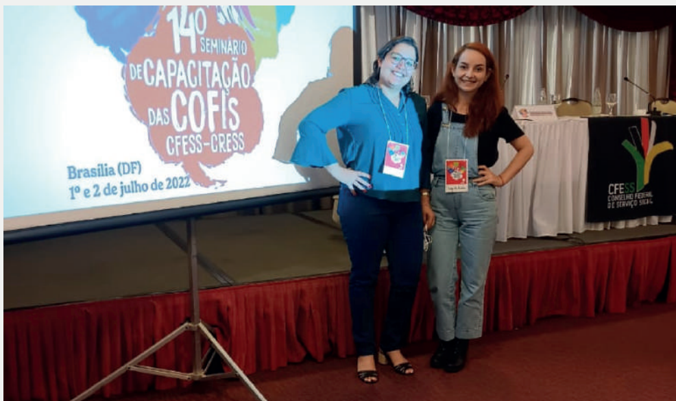
Foto do evento.

O evento foi promovido pelo CFESS e reuniu agentes fiscais e conselheiras/os de todo o Brasil para debaterem o trabalho das Comissões de Orientação e Fiscalização na atual conjuntura, os desafios e possibilidades e a Política Nacional de Fiscalização.